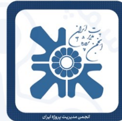
انجمن مدیریت پروژه ایران