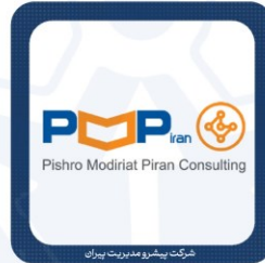
شرکت پیشرو مدیریت پیران